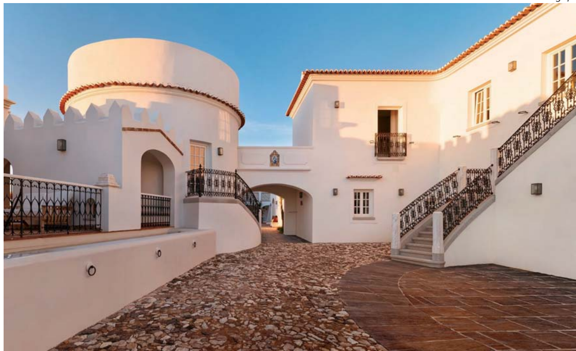
Quinta do Paral The Wine Hotel: ambiente celebra a tradição vinícola