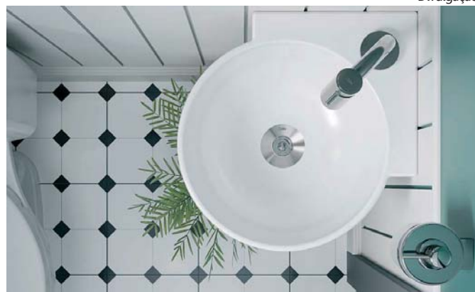
Lavatório Suspenso de Canto M: espaço otimizado

Com produtos pensados para diferentes padrões de espaços, a Celite oferece cubas multifuncionais, móveis, acessórios e bacias sanitárias que transformam o ambiente com beleza e eficiência. A escolha da cuba, por exemplo, é um dos pontos centrais no aproveitamento do espaço do banheiro. Para atender às