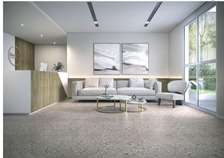
Square: padrão Botticino, combinando com ripado Noce Oro

Square, como as demais linhas Eucafloor, proporciona obra rápida e seca, instalação simples, sem perdas. Fabricado com madeira de eucalipto proveniente de florestas cultivadas, possui selo FSC, é benéfico ao meio ambiente além de ser um produto