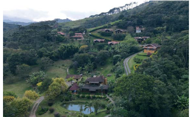
Pousada Quatro Estações de Pinhal: no coração da Mantiqueira