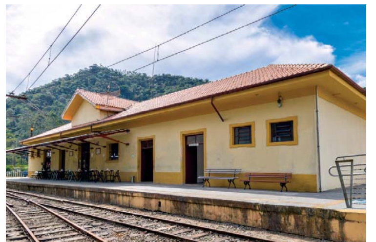
Estação de trem Eugênio Lefèvre, ainda em atividade

Na antiga Estação de trem Eugênio Lefèvre, ainda em atividade, é possível tomar café e provar o famoso bolinho de bacalhau. A poucos metros da estação, também dá para visitar o Mirante Nossa Senhora Auxiliadora, com vista panorâmica para as cidades de Taubaté, Pindamonhangaba e Tremembé.