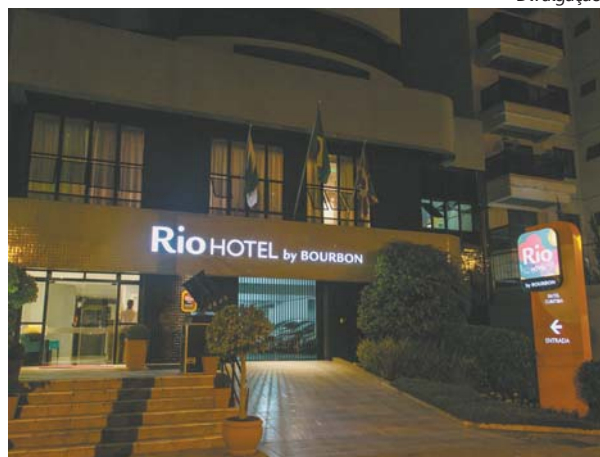
Rio Hotel by Bourbon Curitiba Batel: hóspede com mais conforto