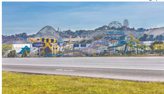
Itupeva: opções dos parques temáticos Hopi Hari e Wet'n Wild e o Outlet Premium São Paulo