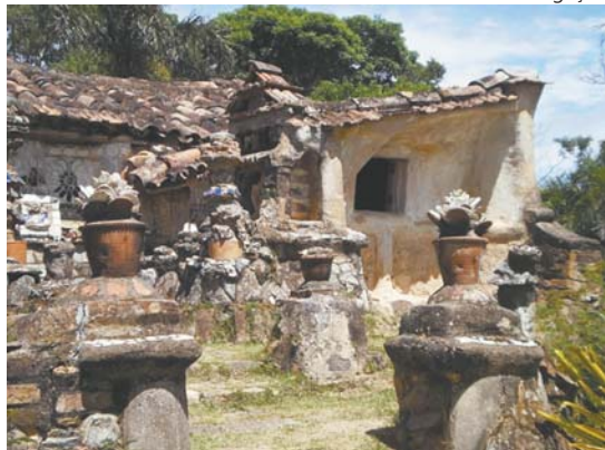
Casa da Flor, em São Pedro da Aldeia, no Rio de Janeiro: aprovada por unanimidade