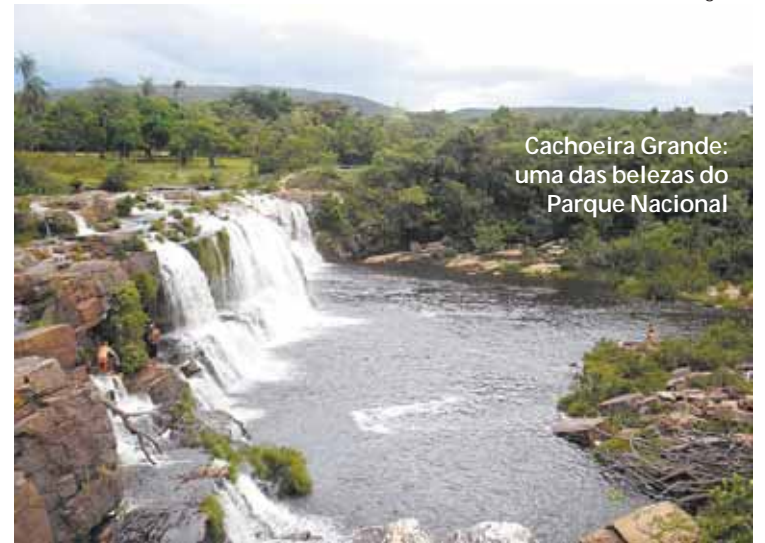
Cachoeira Grande: uma das belezas do Parque Nacional

Além de preservar os ecossistemas locais, possibilitando a realização de pesquisas científicas,