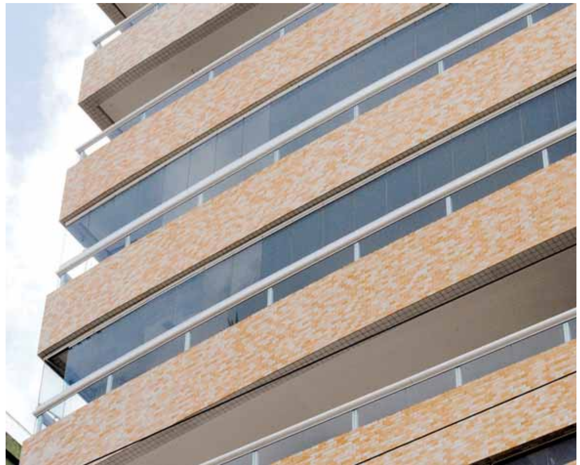
Puerto Madero: primeiro da região a ser entregue com os terraços fechados com Vetro System