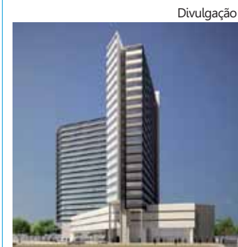
Duas torres: salas comerciais, hotel, lojas e estacionamento

Não foi o caso de Manuela, outra fêmea de veado-catingueiro, que veio do Centro de Triagem de Animais Silvestres, em São Vicente. O intercâmbio é importante, pois evita a consanguinidade, que pode gerar filhotes com anomalias genéticas. Ou seja, o parque, mesmo durante as obras, manteve os cuidados necessários para o bem-estar da fauna e, claro, também da preciosa flora.