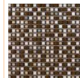
Peças nos formatos 6x6 e 9x6