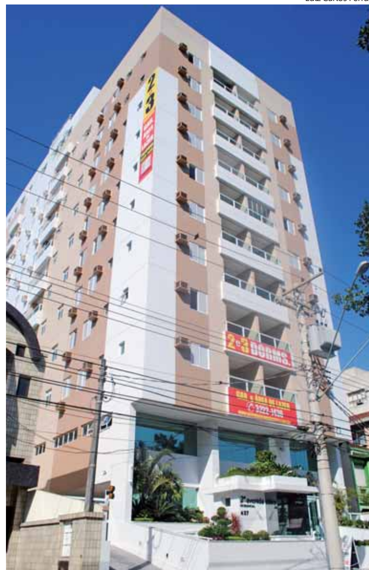
Residencial 2ª Avenida, em Santos: torre com nove andares-tipo contempla 72 apartamentos com garagem privativa

A tecnologia de construção teve a segurança como uma das prioridades, adotando o sistema de fundações profundas, com cravação de estacas a 50 metros de profundidade. O diretor da Estrutura salienta que, apesar das dificuldades inerentes ao atual momento da construção civil, em relação à mão de obra qualificada e alguns tipos de materiais, o ritmo da obra foi tranquilo: “Nosso bom planejamento permitiu o cumprimento do cronograma e, no caso da entrega, até antecipação do