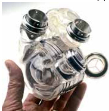
Enquanto o paciente aguarda por doador compatível