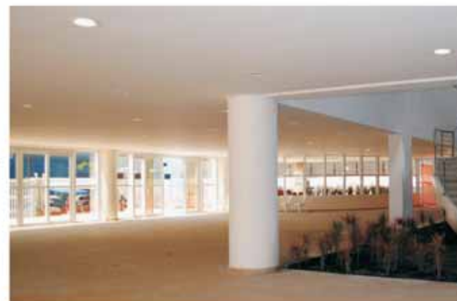
Forro em drywall no campus da Unifesp

AVENIDA GUILHERME, 1.055 | VILA GUILHERME | SÃO PAULO