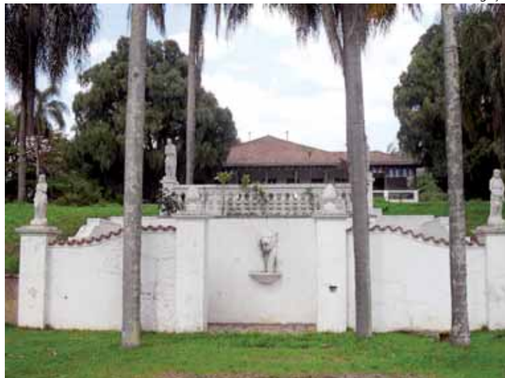
Imóvel centenário possui diversas construções e jardins e está sendo recuperado pela organização

Implantado há mais de 100 anos, o imóvel possui diversas construções e jardins e está sendo recuperado pela organização e expositores para abrigar mais de 50 ambientes internos e externos.