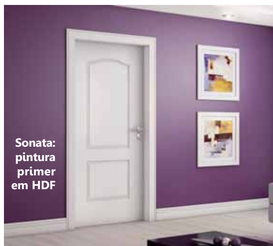
Sonata: pintura primer em HDF