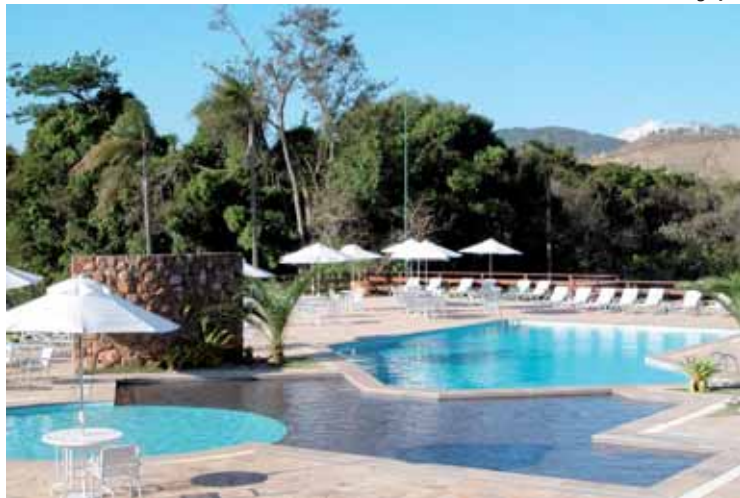
Canto da Floresta Ecoresort, em Amparo: no ar, o perfume de incenso preparado em mosteiros hindus e budistas