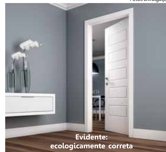
Evidente: ecologicamente correta

A porta Eucadoor pode ser acompanhada por guarnições de 80 e 100 mm. As de 100 mm têm duas opções: com linhas arredondadas ou retas, seguindo o estilo contemporâneo. Já o modelo de 80 mm, combina com todos os estilos de decoração. As guarnições estão disponíveis na cor branca e dispensam acabamento adicional.