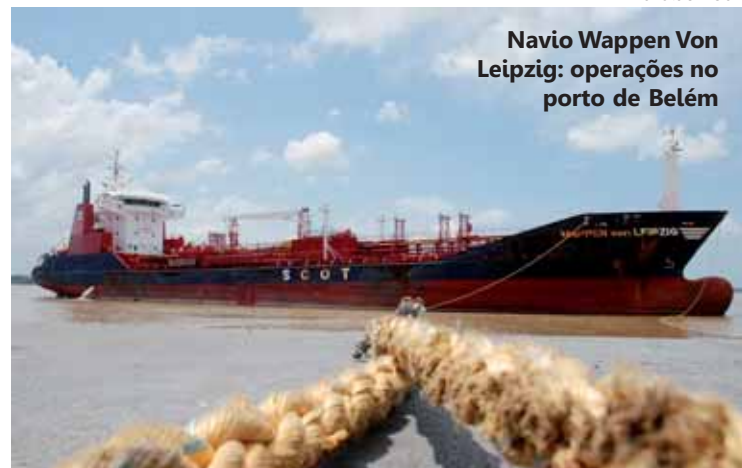
Advaldo Nobre Navio Wappen Von Leipzig: operações no porto de Belém

“O perfil do consumidor muda a passos largos e os novos são jovens atualizados com esses conceitos e não aceitam que práticas nocivas à nova realidade socioambiental faça parte de um produto ou marca”, frisa Brito: “Isso despertou o interesse das