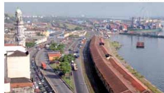
Projeto revitalizará faixa portuária do Centro Histórico

O Porto Valongo é um projeto de revitalização de faixa portuária do Centro Histórico de Santos, inspirado em polos turísticos similares, como em Los Angeles, Buenos Aires, Barcelona e Gênova. Ele envolve a área de 8 grandes armazéns desativados, com a criação do Instituto Oceanográfico da USP e Unifesp, novo terminal de