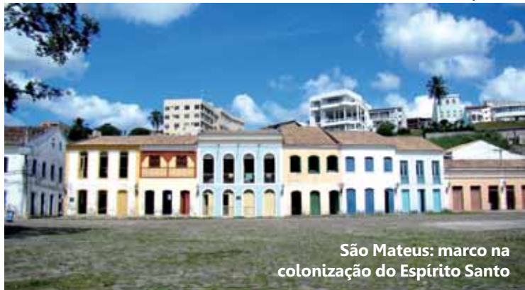
São Mateus: marco na colonização do Espírito Santo