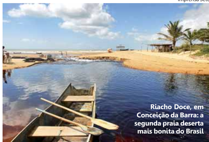
Riacho Doce, em Conceição da Barra: a segunda praia deserta mais bonita do Brasil