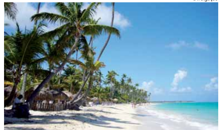
Praias de areia fina e branca: descanso e aventura no Caribe

agradável durante o ano todo. Para o Carnaval, a Fenix Operadora programou pacote com 8 dias de viagem, incluindo 7 noites no hotel NH Real Arena ( all inclusive ),