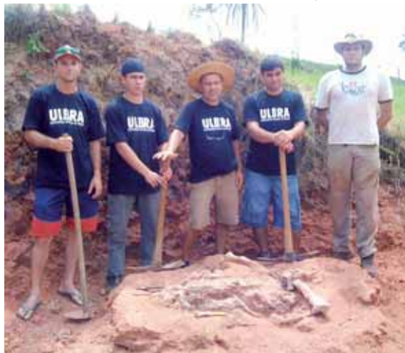
Equipe da Ulbra: fósseis de presa e predador