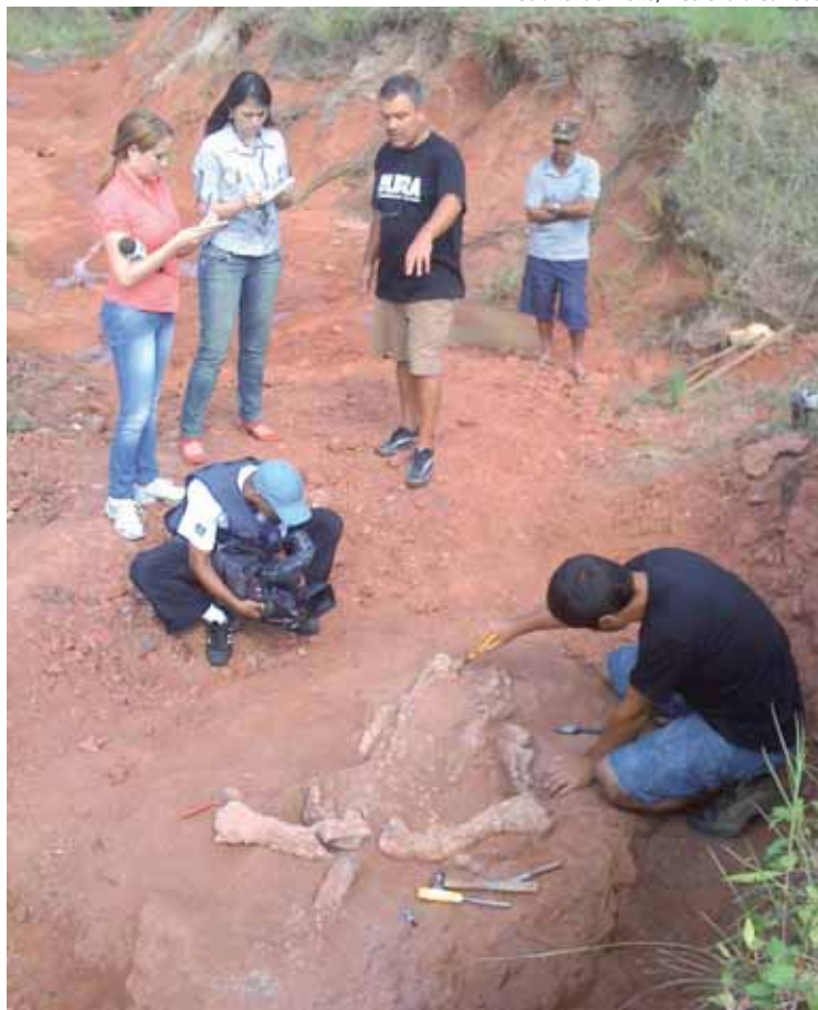
Gabriel de Mello/ACS Ulbra Canoas

A implantação de unidades de conservação é um dos requisitos do processo de licenciamento ambiental de empreendimentos com significativo impacto ao meio ambiente. A criação e instalação dessas unidades atende ao disposto no Sistema Nacional de Unidades de Conservação (SNUC), que prevê que o investimento em unidades de conservação seja de, no mínimo, 0,5% do custo total previsto para a implantação do empreendimento.