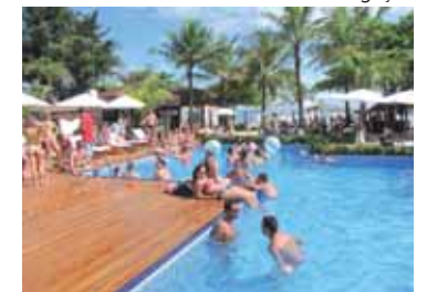
De frente para o mar: piscina, música eletrônica...