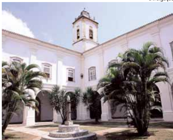
Pestana Convento: na seleta lista da The Small Leading Hotels of the World