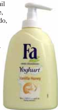
Fa: iogurte para suas mãos

■ Alemã Fa está lançando no mercado brasileiro a Fa Hand Creamwash, um sabonete cremoso com fórmula inovadora, que limpa a pele sem ressecá-la. Possui pH neutro e é feito à base de proteínas do iogurte, que reestruturam a emulsão epicutânea (revestimento da epiderme, hidratante e produzido naturalmente), em duas versões: Yoghurt Vanilla Honey e Yoghurt Aloe Vera.