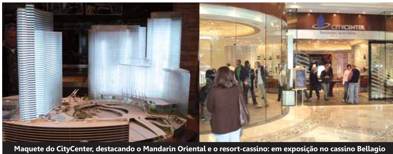
Maquete do CityCenter, destacando o Mandarin Oriental e o resort-cassino: em exposição no cassino Bellagio

Veer Tower East e Veer Tower West são duas torres em losango, ligeiramente inclinadas, com unidades residenciais no estilo penthouse, apartamento e estúdio. O projeto é do arquiteto Helmut Jahn, de Chicago, celebrado por criar edifícios inusitados. Pelo complexo do CityCenter passará o monorrelho, interligando-o aos vizinhos Monte Carlo e Bellagio.