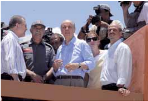
Serra em Guarujá: obras de saneamento na Baixada Santista