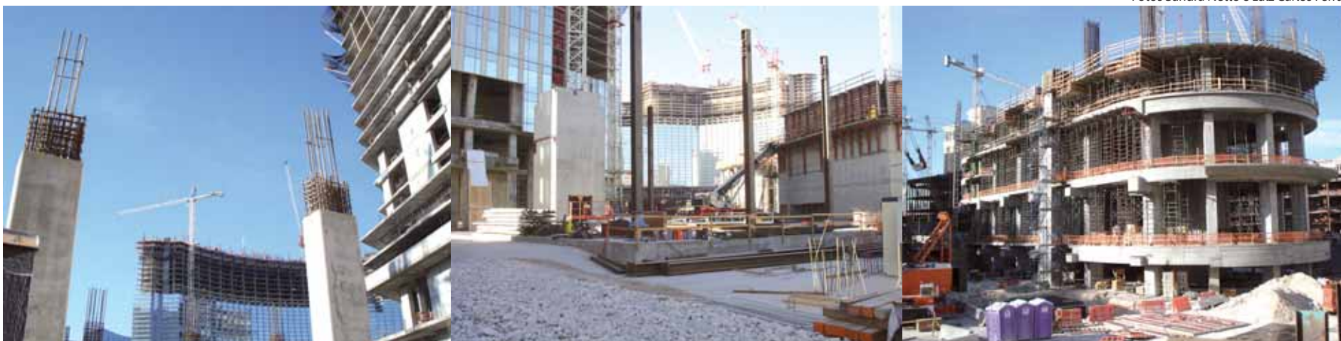
Obras do CityCenter são realizadas em várias frentes para a abertura em novembro de 2009: complexo enfatiza o conceito de condomínio junto com resort e cassino