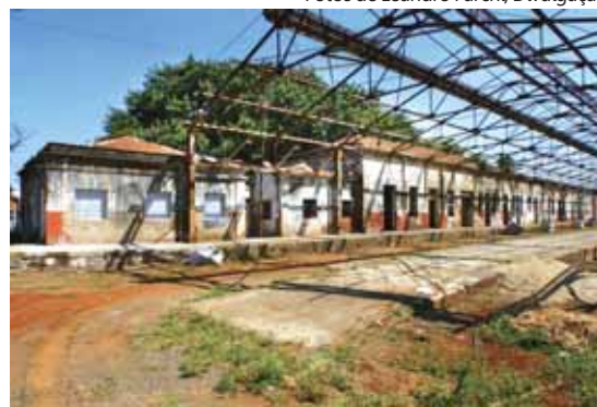
Lado interno da Estação Guanabara, com vista parcial da gare inglesa