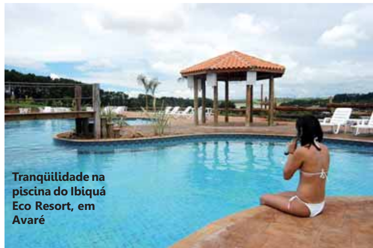
Tranquilidade na piscina do Ibiquá Eco Resort, em Avaré