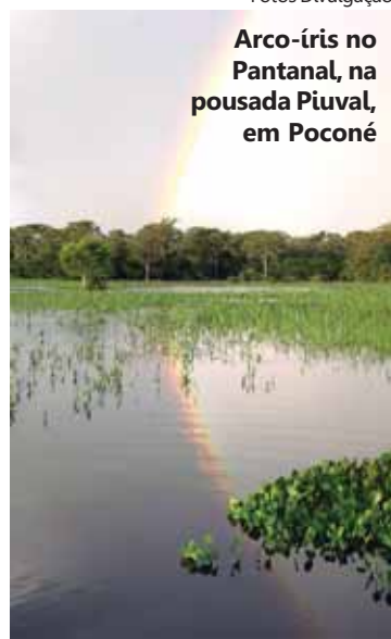
Arco-íris no Pantanal, na pousada Piuval, em Poconé

■ Ibiquá Eco Resort, em Avaré, telefone (14) 3733.2999, www.ibiqua.com.br ; Pousada Recanto dos Saltos, em Brotas, telefone (14) 3653.8000, www.brotasaventura.com.br ; Pousada Piuval, na Fazenda Ipiranga, em Poconé, Mato Grosso, telefone (65) 3345.1338, www.pousadapiuval.com.br