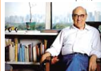
Guedes: reorganizar debate

Sol, praia, amigos e festas. Realmente é o aniversário perfeito.