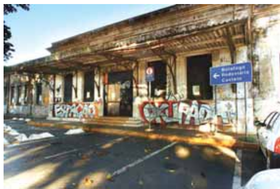
Estação Guanabara: sob a responsabilidade da Unicamp desde 1990

Dicas e sugestões para flaviaferraz@jornalperspectiva.com.br