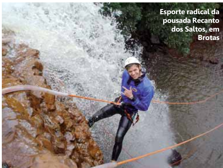
Esporte radical da pousada Recanto dos Saltos, em Brotas