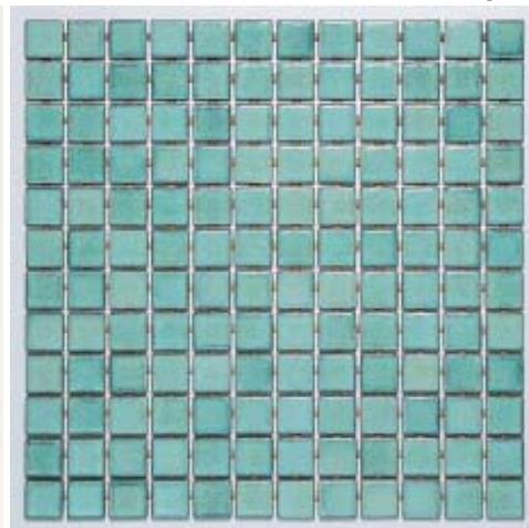
Saona (5x5), Magma (hexagonal) e Caicos (5x5): céu, terra e mar, para renovar a energia do seu lar no ano novo

maior número de nuances possíveis de variações é o azul, que transita entre o tom pastel do céu ao escuro tom marinho dos oceanos. Tal como na natureza, a cerâmica Atlas conta com uma abrangente paleta de tonalidades, variáveis do tradicional Classic Blue – cor escolhida pela Pantone em 2020, até o tom mais claro, que se mescla aos sutis cinza e branco. Nos ambientes, a cor pode ser aplicada em piscinas, banheiros e até compor uma delicada cozinha azul clarinha, ou forte, com