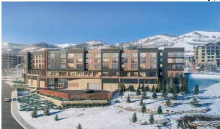
Yotepad Park City: apartamentos completos em Canyons Village

O charmoso hotel de luxo que apresenta elementos inspirados na cultura austríaca, Goldener Hirsch Inn, realizou uma expansão com a The Goldener Hirsch Residences, uma interpretação moderna de acomodações na montanha. São 40 novas residências – de estúdios até casas com quatro quartos, divididas em dois edifícios com estilo