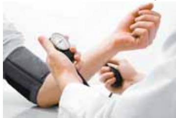
Doença silenciosa dificilmente apresenta sintomas