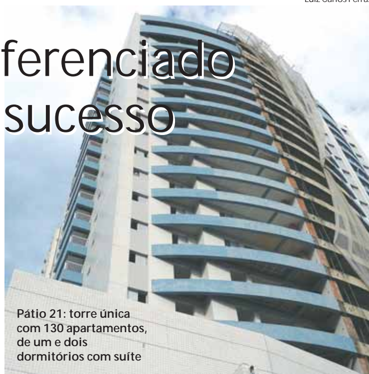
Pátio 21: torre única com 130 apartamentos, de um e dois dormitórios com suíte

“Enfrentando uma forte concorrência, fomos em busca de algo singular para o nosso produto”, afirmou o diretor da WDS: “Assim,