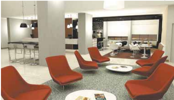
Rio Hotel by Bourbon: alegria, diversidade, inovação e descontração no conceito da nova marca