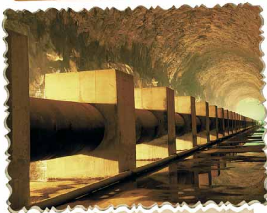
Adutora que conduz milhões de litros de água por segundo para o imenso reservatório que está escondido abaixo do Morro de Santa Tereza. Esta foto é de 1981.

Construído entre as décadas de 70 e 80, quando a situação do abastecimento de água em Santos era crítica, o Reservatório-Túnel Santa Tereza-Voturuá até hoje ostenta o título de “O maior da América Latina”. É um gigante de números expressivos. Em seus 1.100 metros de escavações entre galerias e reservatórios dentro do maciço rochoso que divide a ilha de São Vicente, apresenta túneis com 20 metros de altura (o equivalente a um prédio de seis andares) e 15 metros de largura (o que daria para uma estrada de quatro pistas de rolagem). Em relação à água, são simplesmente 110 milhões de litros, o equivalente a 44 piscinas olímpicas cheias até a borda. É água que não acaba mais!