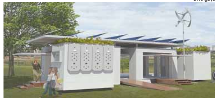
Casa Aqua: projeto sustentável na Casa Cor São Paulo