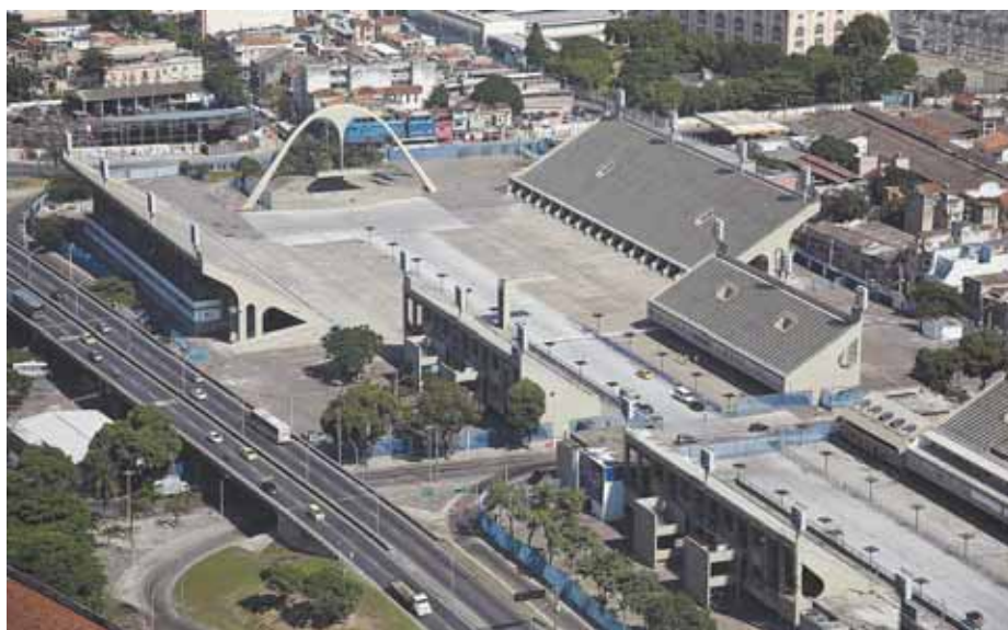
Passarela do Samba da cidade do Rio de Janeiro, inaugurada em 1983 para 60 mil pessoas, e a praça da Apoteose com seu arco parabólico de concreto

A proposta de tombamento se dá especificamente aos monumentos do parque que foram projetados por Niemeyer. Por sua relevância urbanística e cultural poderão ser inscritos no Livro do Tombo Histórico e no Livro do Tombo das Belas Artes. São eles: a Grande Marquise, o Palácio das Nações (Pavilhão Manoel da Nóbrega, atualmente ocupado pelo Museu Afro Brasil), o Palácio dos Estados (Pavilhão Francisco Matarazzo Sobrinho, atualmente desocupado), o Palácio das Indústrias (Pavilhão Armando de Arruda Pereira, atualmente ocupado pela Fundação Bienal), o Palácio de Exposições ou das Artes (Pavilhão Lucas Nogueira Garcez, também conhecido como Oca, atualmente ocupado para grandes exposições), e o Palácio da Agricultura (atualmente ocupado pelo Museu de Arte Contemporânea da USP).