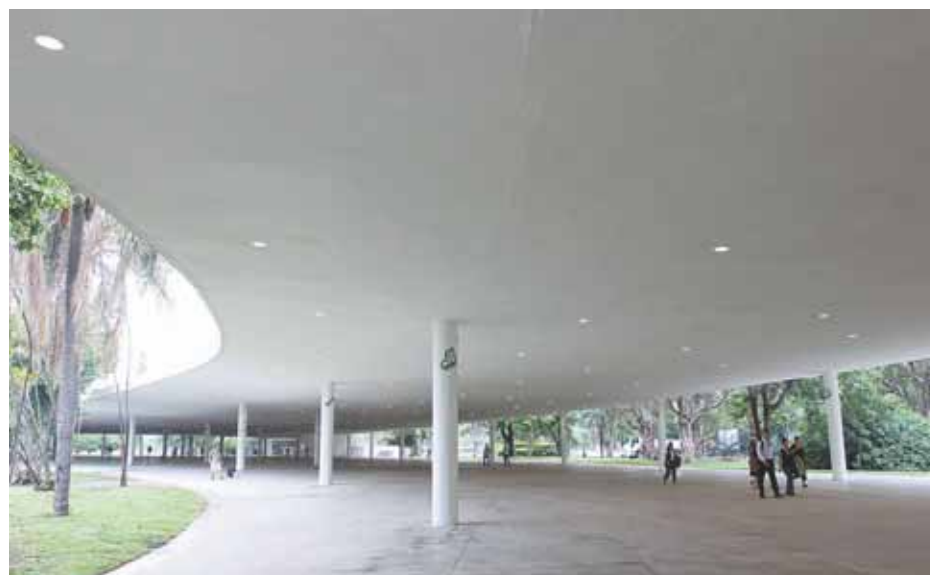
A Grande Marquise, uma das atrações do Parque do Ibirapuera, em São Paulo: entregue em 1954, nas comemorações dos 400 anos da capital