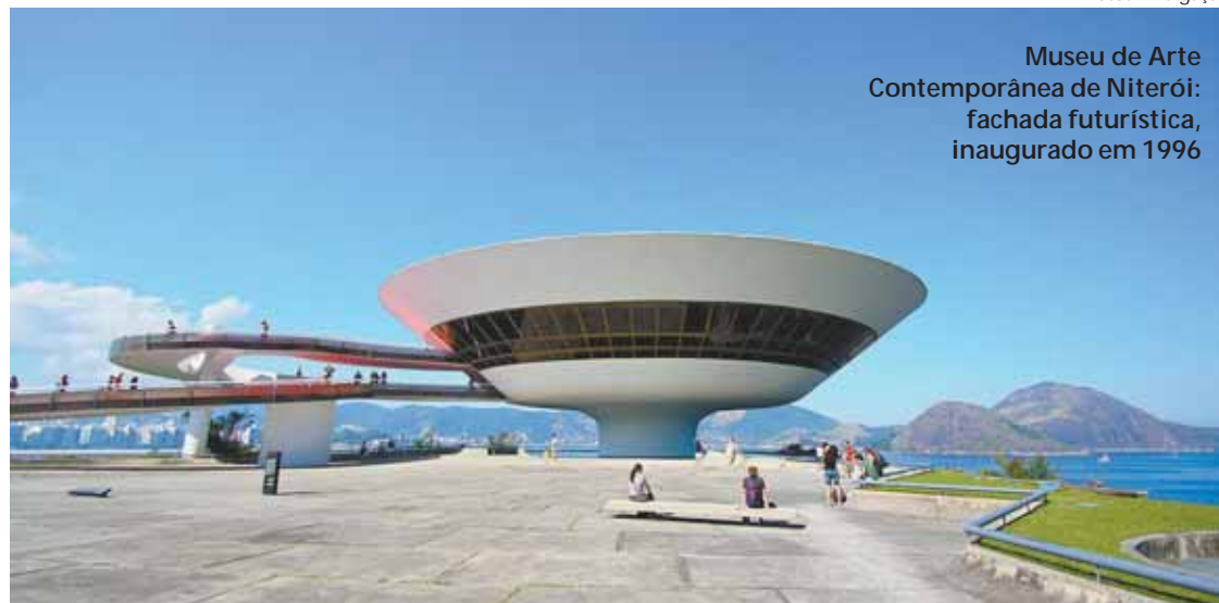
Museu de Arte Contemporânea de Niterói: fachada futurística, inaugurado em 1996

Inaugurado em setembro de 1996, o MAC tem arquitetura ousada. Sua forma se assemelha a de um disco voador e a fachada futurística oferece aos visitantes uma vista panorâmica inigualável. O Museu tem 2,5 mil metros