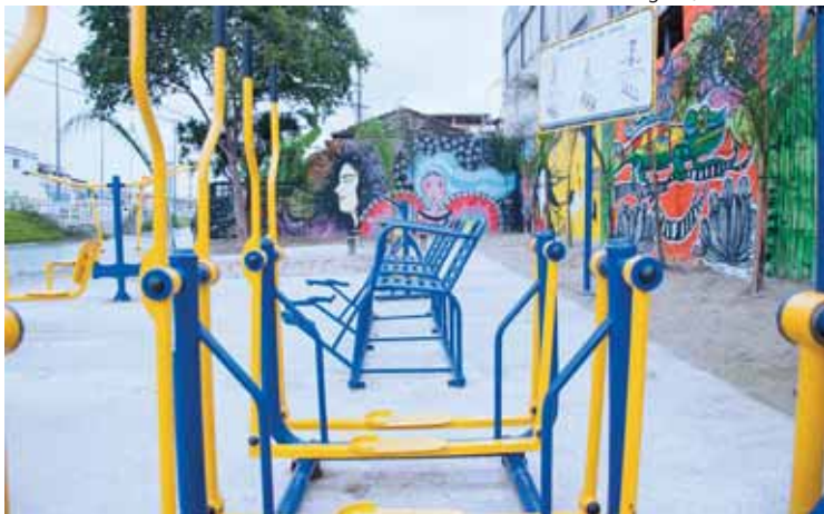
Academia na Linha Amarela, no Catiapoã: arte de grafiteiros