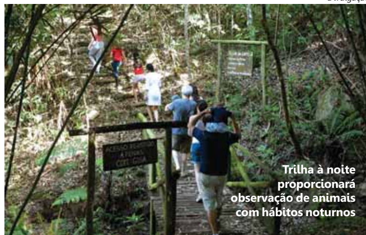
Trilha à noite proporcionará observação de animais com hábitos noturnos

90 km da capital paulista, a Fazenda Capoava é rodeada por serras e belas paisagens. No ano de 2000 a parte histórica da propriedade foi transformada em hotel, distribuído em meio a cinco grandes lagos. Hoje a fazenda faz parte da Associação