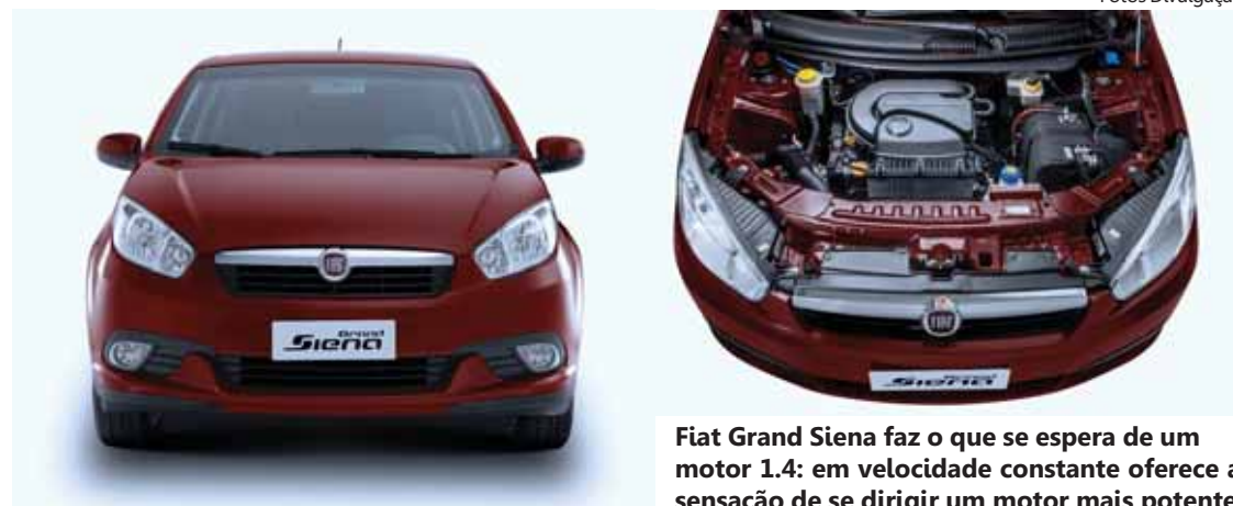
Fiat Grand Siena faz o que se espera de um motor 1.4: em velocidade constante oferece a sensação de se dirigir um motor mais potente

A dirigibilidade é boa. A suspensão agrada, tanto no trajeto urbano quanto na rodovia. Freios ABS, direção hidráulica, ar-