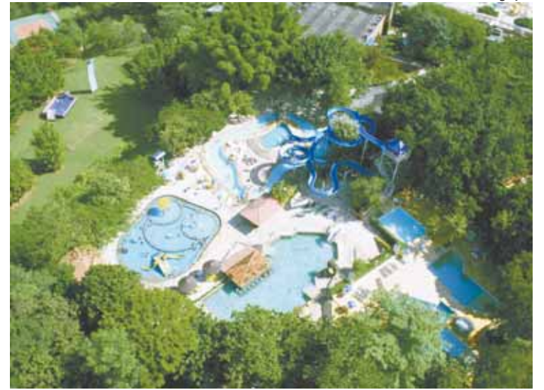
Thermas diRoma Hotel: lazer com ampla infraestrutura