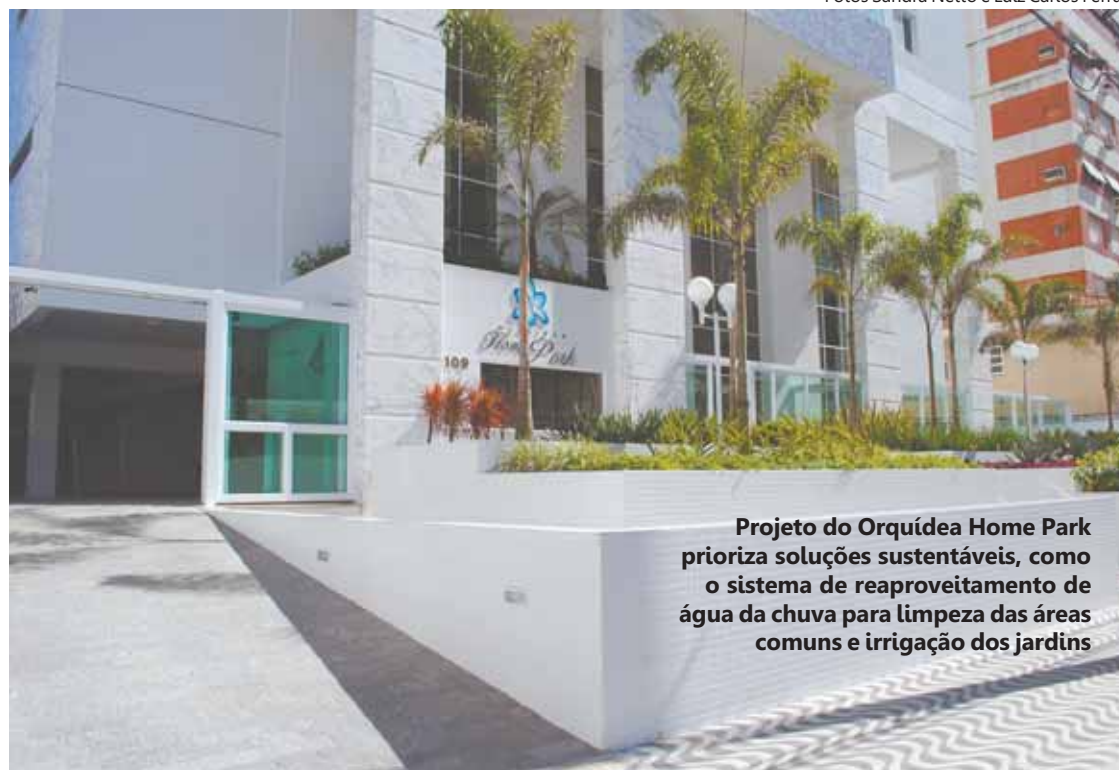
Projeto do Orquídea Home Park prioriza soluções sustentáveis, como o sistema de reaproveitamento de água da chuva para limpeza das áreas comuns e irrigação dos jardins