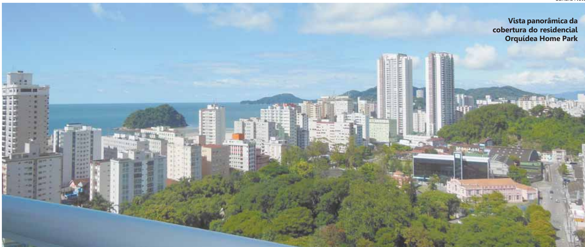
Vista panorâmica da cobertura do residencial Orquídea Home Park