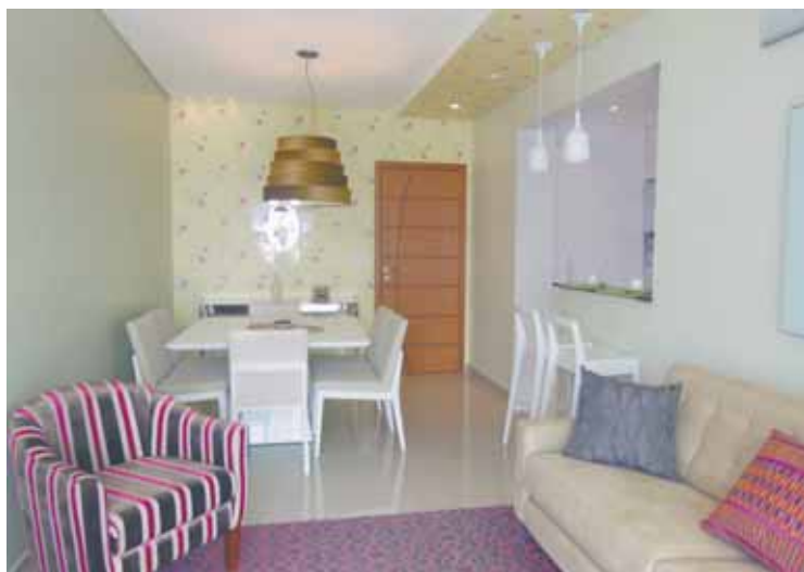
Apartamentos decorados: aproveitamento dos espaços e acessível