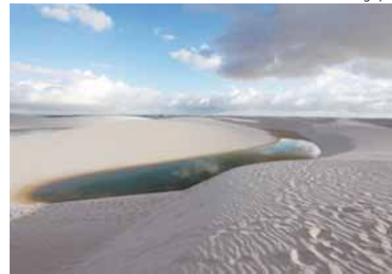
Lençóis Maranhenses: dica do ministro Gastão Vieira