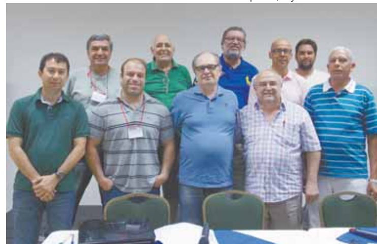
Diretoria da Adjori-SP: esforços para ampliar cada vez mais a credibilidade e representatividade dos jornais regionais

Os empresários demonstraram preocupação com a lei que