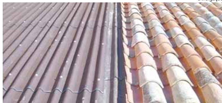
Subcobertura garante eficiência e versatilidade à arquitetura

Para a instalação e restauração é recomendado que, após a retirada das telhas tradicionais, seja verificado se o madeiramento está