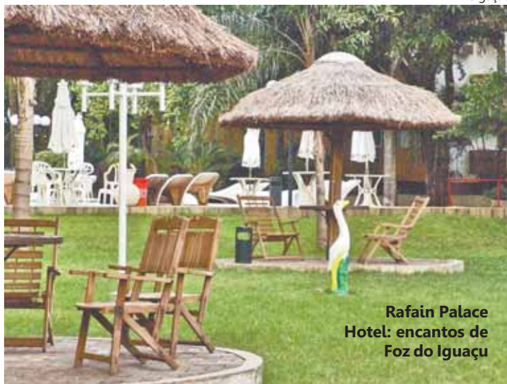
Rafain Palace Hotel: encantos de Foz do Iguaçu