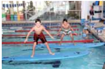
Exercícios para praticar no mar nos finais de semana