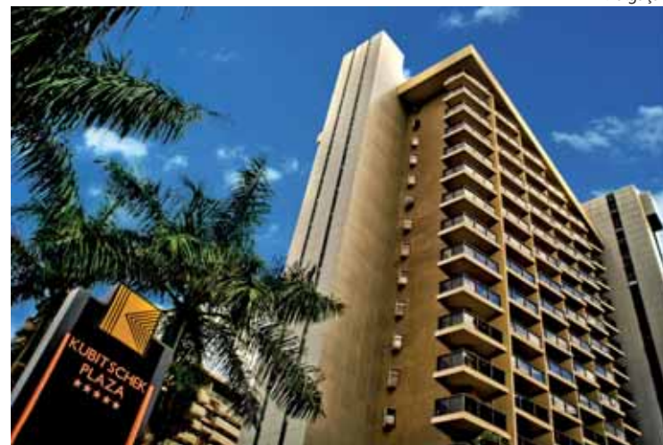
Kubitschke Plaza Hotel, em Brasília: 5 estrelas

Comemorando cada nova certificação, o Ministério do Turismo (MTur) anunciou em janeiro que mais três hotéis foram incorporados à lista de empreendimentos integrados ao Sistema Brasileiro de Classificação de Meios de Hospedagem (SBClass). Com as novas adesões – de Brasília (DF), Porto Alegre (RS) e Campo Mourão (PR) –, o país começa 2013 com 26 hotéis de 11 Estados ajustados à metodologia desenvolvida em parceria com o Inmetro, iniciado em 2011, e que envolve hotéis, resorts e pousadas identificados por “estrelas”. “É um bom resultado, já que a adesão é voluntária”, avalia o secretário nacional de Políticas de Turismo do MTur, Vinícius Lummertz: “Aos poucos, os empresários vão entendendo a importância de classificarem seus empreendimentos