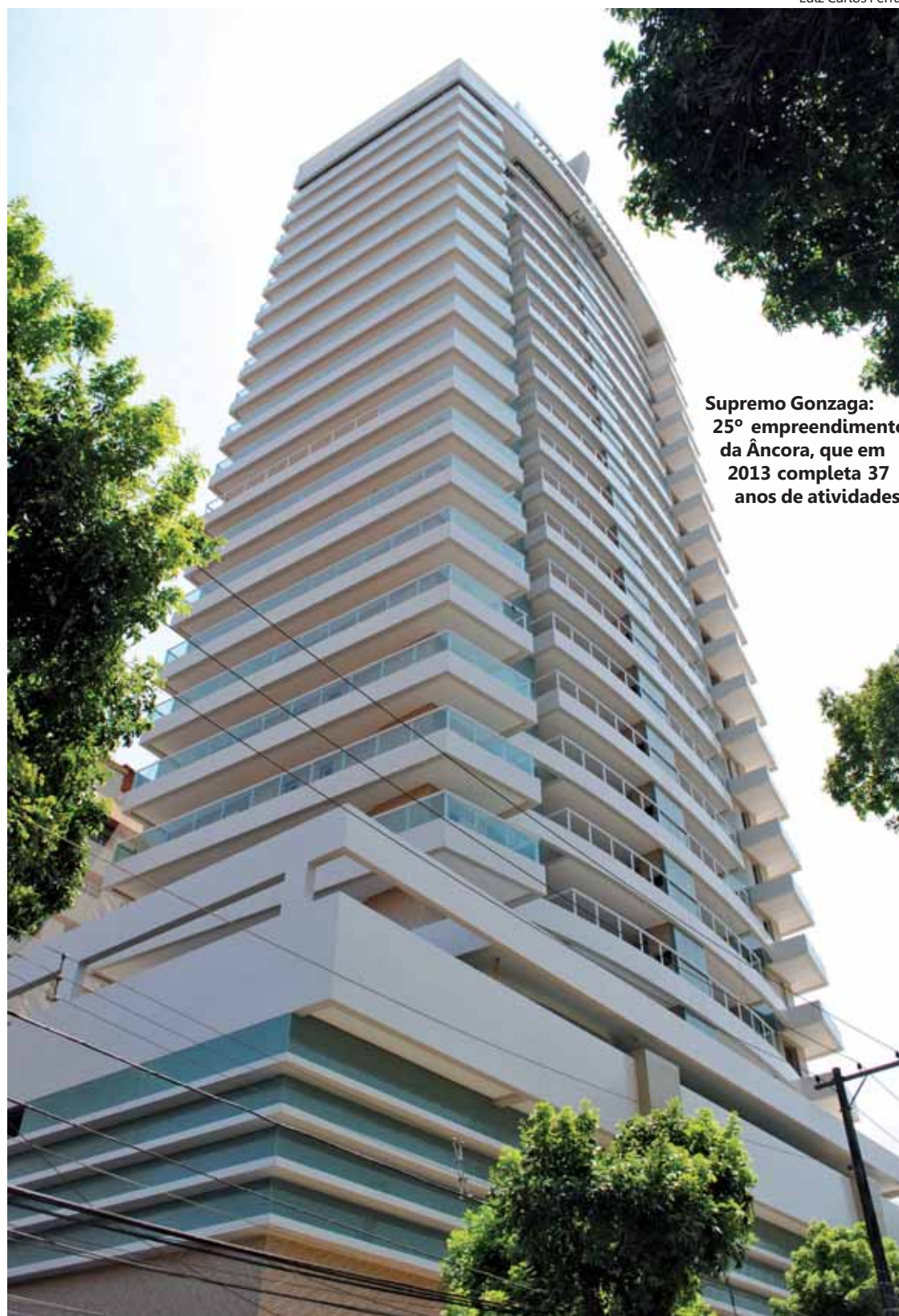
Supremo Gonzaga: 25º empreendimento da Âncora, que em 2013 completa 37 anos de atividades

Entre outras características do projeto arquitetônico, a diretora resalta a flexibilidade da planta, com quatro ou três suítes, no caso da opção pelo living ampliado. Todos os apartamentos possuem varanda gourmet com churrasqueira, suíte master com banho do senhor e senhora, suítes com terraço de 50 metros quadrados, home theater, home office, lavabo, estúdio reversível, WC de empregada, terraço técnico para instalação de equipamentos split e aquecedor, 3 vagas de garagem e depósito externo.