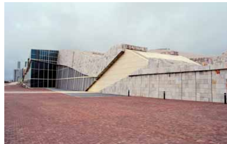
Edifícios da Biblioteca e do Arquivo foram inaugurados em 11 de janeiro do ano passado pelos Príncipes das Astúrias