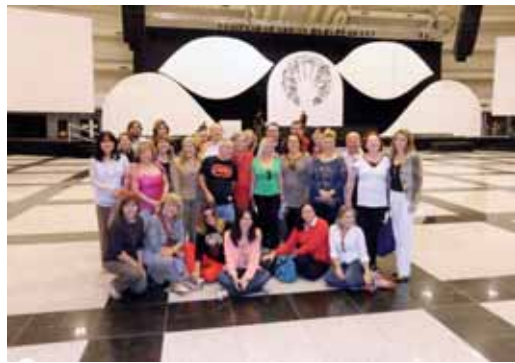
Colunistas em site inspection no WTC Convention Center