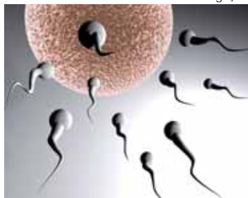
Tecnologias dão esperança ao desejo de ter filho