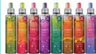
Opções do beautydrink: “beleza agora tem sabor”

riscos. A atenção com o tamanho da barriga deve ser redobrada após os 30 anos. “Os cuidados são os mesmos de qualquer paciente com obesidade: dieta balanceada e equilibrada sem calorias em excesso, atividade física regular e acompanhamento médico e nutricional. Exercício abdominal fortalece a musculatura, mas não elimina em nada a gordura abdominal”. Mais comum em homens, a gordura abdominal não é exclusiva do sexo masculino. “A mulher costuma ganhar mais quadril e coxas e homem mais barriga”, compara, ao alertar sobre o uso de chás e cremes que prometem eliminar a gordura indesejada.