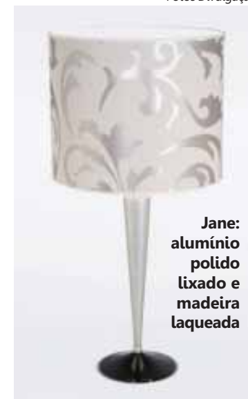
Jane: alumínio polido lixado e madeira laqueada

A instalação do piso Aquaclac dispensa o tradicional quebra-quebra e pode ser feita sobre o piso já existente, como concreto, cerâmica, madeira e vinil, desde que este esteja nivelado, sem mofo e imperfeições. Além disso, graças à tecnologia Uniclic não há necessidade de cola, ferramentas ou mão de obra especializada. É só encaixar as régua de 1220 mm x 180 mm, com espessura de 5 mm.