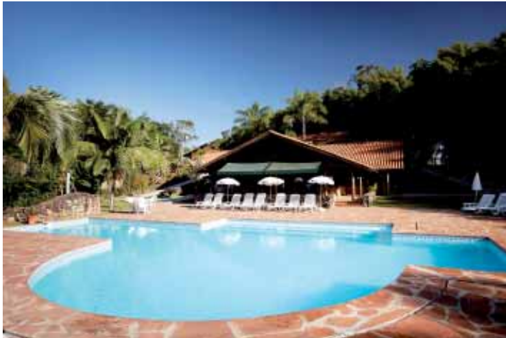
Pousada do Quilombo: inserida na comunidade, cercada pelas belezas naturais da Serra da Mantiqueira