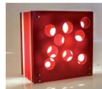
Pops: acrílico e polipropileno

A ObraVip.com oferece opções de luminárias, das clássicas às modernas, passando pelas juvenis, com tonalidades neutras e até mais coloridas, para deixar os ambientes mais aconchegantes, descontraídos ou românticos. A proposta da boutique virtual é proporcionar uma forma fácil, rápida, cômoda e confiável, de escolher produtos para interiores. Num único lugar, é possível encontrar variedade de produtos para construir e decorar ambientes requintados, organizando-os de maneira objetiva, por meio de departamentos, categorias e marcas. Mais no site www.obravip.com