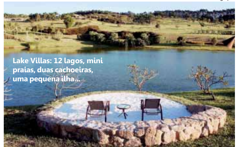
Lake Villas: 12 lagos, mini praias, duas cachoeiras, uma pequena ilha...