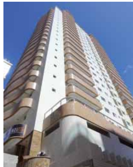
Residencial Spazio Del Mar, no Canto do Forte: focado no segmento de alto padrão

dos dormitórios e porta da sala; mini boreal, da área de serviço; e temperado de 10 mm incolor, do térreo. A DNA também forneceu os perfis de alumínio para a fachada, da linha Skalla, enquanto os perfis dos caixilhos da sala são da linha Ajax; nos dormitórios, banhos e área de serviço, os