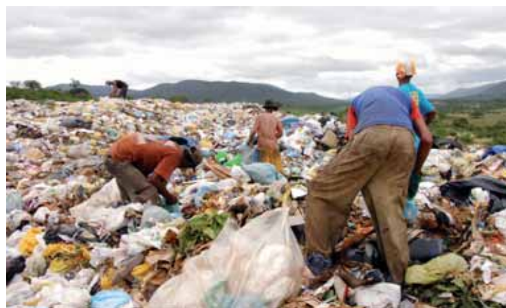
Lei impõe que lixões deverão ser substituídos até agosto de 2014

Com a aprovação da lei, foi programada a destinação de recursos federais para a aquisição de terrenos, projetos, licenciamentos e instalação