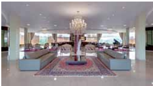
Hall do Ecologic Ville Resort & Spa

Serviço – O Ecologic Ville Resort & Spa está situado na Rua Juscelino Kubitschek, 15, Caldas Novas, Goiás, www.ecologicvilleresort.com.br