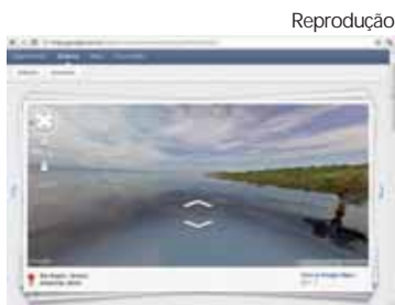
Rio Negro, na Amazônia: imagens em 360 graus