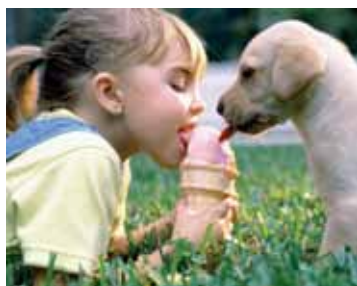
Crianças e animais de estimação: riscos a evitar