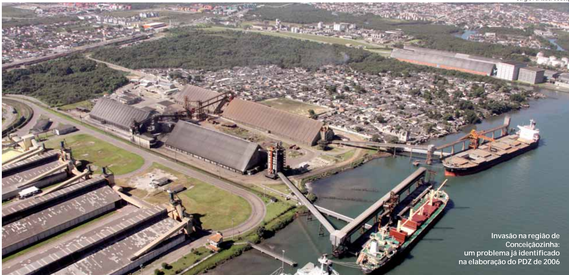
Invasão na região de Conceiçãozinha: um problema já identificado na elaboração do PDZ de 2006