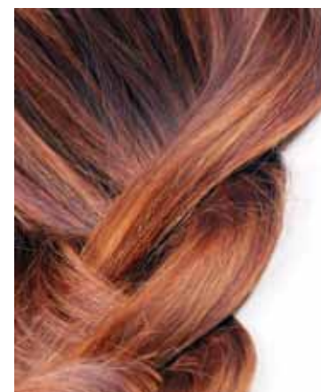
Aparência dos cabelos merece atenção especial

Instituto de Reumatologia e Doenças Osteoarticulares. “O dado novo do estudo