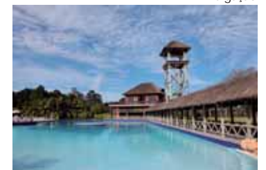
Resort atrai empresas paulistas