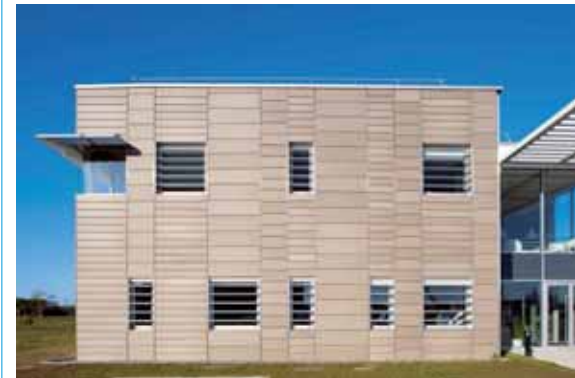
Fachada ventilada Maestral: parceria distribui produtos do grupo francês