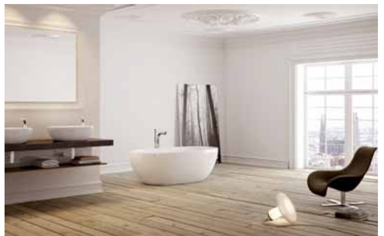
Quarrycast: material desenvolvido com rocha vulcânica e resina