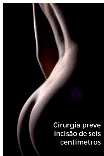
Cirurgia prevê incisão de seis centímetros

Com o fim do Verão, surge enfim a oportunidade de programar correções no corpo e se preparar para exibi-lo nas praias na próxima temporada. Um dos alvos preferidos da mulher é o bumbum, visando deixá-lo mais “esculpido” por meio da colocação de próteses entre os músculos dos glúteos. Conforme explica o diretor do Centro Nacional de Cirurgia Plástica, Arnaldo Korn, a cirurgia do bumbum pode ser feita de diversas maneiras, mas a mais satisfatória é a que utiliza uma incisão de seis centímetros, com anestesia geral ou local: “A cicatriz é praticamente invisível. Depois de colocada a prótese, primeiro o