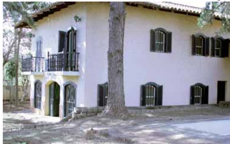
Casa foi escolhida pela sua arquitetura e espaços generosos

Em 50 ambientes, o desafio dos profissionais que farão parte da mostra será criar espaços que atendam às necessidades de uma família, com integrantes de diferentes faixas etárias, profissões e estilos, mas que mantêm viva a