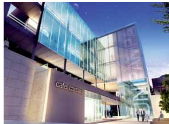
Projeto será construído em Santana do Livramento

Projeto da Ideia1 Arquitetura venceu o concurso promovido pela Universidade Federal do Pampa, Unipampa, para ampliação do campus em Santana do Livramento, no Rio Grande do Sul, com novas salas de aula, prédio administrativo, refeitório, biblioteca e auditório para 400 pessoas. O projeto, que soma cerca de 5.000 m 2 , procura respeitar o prédio histórico existente e propõe o uso abundante de vidro, em contraste com a edificação antiga, que tem mais cheios que vazados. As edificações terão um único núcleo vertical de escada e elevadores, para resolver a acessibilidade de toda a universidade. O pátio central, em frente ao novo prédio, foi rebaixado,