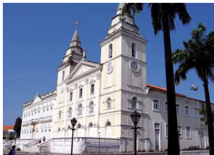
Catedral de Nossa Senhora da Vitória, mais conhecida como Igreja da Sé, também candidata a Tesouro