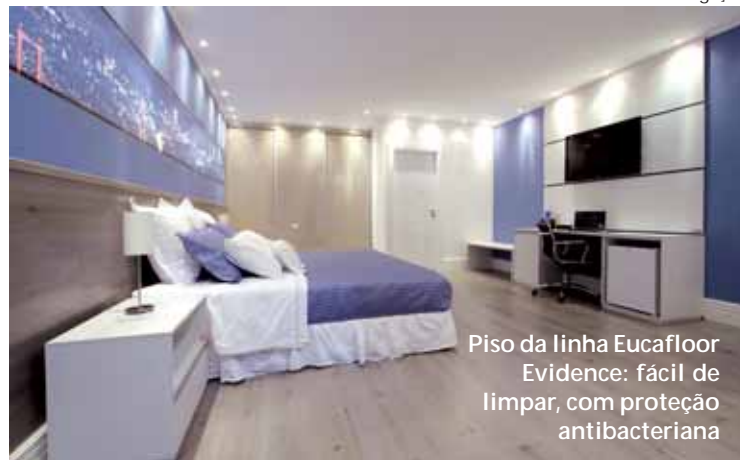
Piso da linha Eucafloor Evidence: fácil de limpar, com proteção antibacteriana

A Eucatex apresenta diversas opções econômicas, práticas e modernas em tintas, pisos e rodapés, para quem planeja renovar ambientes, embalado pelo clima de mudanças proporcionado pelo Ano Novo. No piso, os novos padrões da linha Eucafloor Evidence são fáceis de limpar e contam com a proteção do antibacteriano Bacterban. As tonalidades claras, como o Kalahari (uma mistura de branco com acinzentado), colaboram para a criação de ambientes amplos, sendo ideais para salas e quartos. Já as escuras, como o Antique Wood (marrom com nuances de bege claro), e a Italian Noce (caramelo), combinam com os rodapés brancos da linha Composit, 160 e 200 mm – possibilitando uma decoração personalizada, pois podem ser