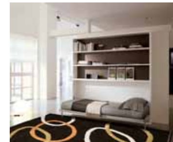
Showroom com linhas de camas retráteis da Clei

A Lit Concept, especializada em mobiliário funcional, iniciou a venda dos móveis transformáveis da marca italiana Clei. Entre as opções no showroom da Rua Itapicuru, 656, em Perdizes, São Paulo, duas linhas de camas retráteis e complementos: a Circe, um sofá que se articula automaticamente e se transforma em uma cama retrátil de casal Queen, e a Poppi, uma mesa de escritório que, quando articulada, se transforma em uma cama retrátil de solteiro com abertura lateral. Móveis do catálogo e do site oficial da Clei também estão à venda. É o caso do modelo Doc, um sofá confortável que por meio de um movimento simples se transforma numa beliche com duas camas de solteiro, e do Cabrio, composto de uma cama de solteiro de abertura lateral e de