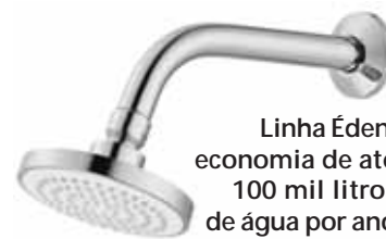
Linha Éden: economia de até 100 mil litros de água por ano

A linha de chuveiros Éden, da Adocol Metais Sanitários, inova ao proporcionar conforto e baixo consumo de água na hora do banho. A economia é garantida pelo restritor de vazão que vem aplicado ao