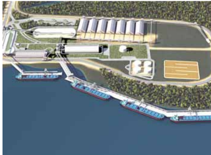
Acima, maquete do projeto: construção de ferrovia interna, prédios administrativos, armazéns e mais três berços de atração; ao lado, planta aplicada à área

O investimento previsto é de R$ 1,1 bilhão, com a geração de 1.200 a 2.500 empregos, na fase de obras, e ampliação de 230 para 780 postos de trabalho, na operação do terminal. O projeto de ampliação prevê a construção de uma ferrovia interna, para transporte da carga da origem até os silos de armazenamento, de novos prédios administrativos, além de armazéns e mais três berços de atração; atualmente, o terminal opera com