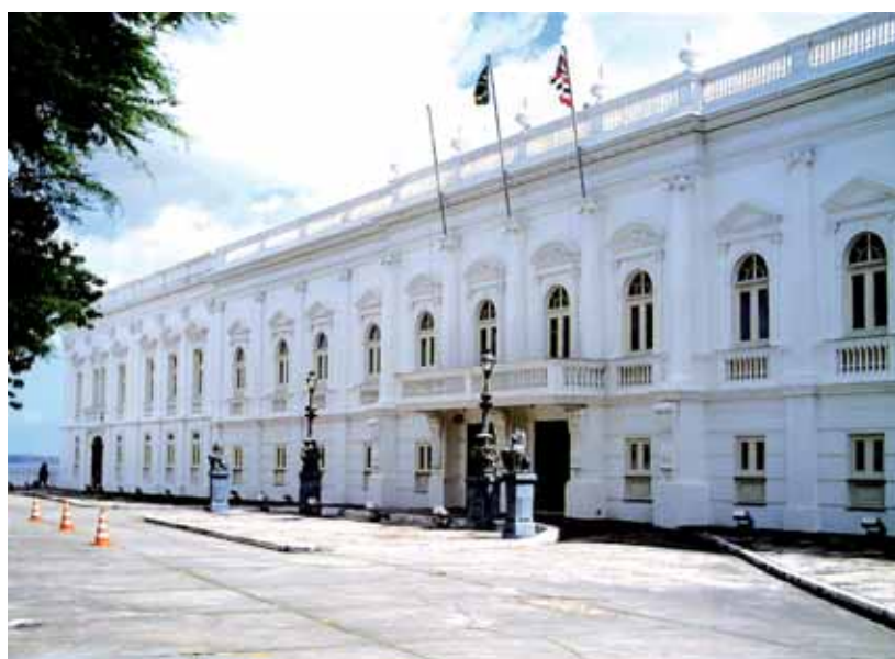
Palácio dos Leões: o edifício-sede do governo do Estado do Maranhão, no Centro Histórico de São Luís