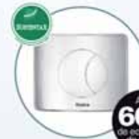
Válvula Hydra Duo