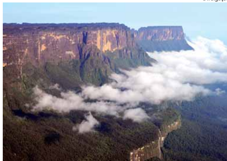
Roteiro oferece vista espetacular do Monte Roraima e inclui acampamento no Rio Tek, visitas ao Vale dos Cristais e ao El Fosso

A partir de setembro, o Swiss Hotel Management School (SHMS) e o Senac São Paulo iniciam intercâmbio que vai possibilitar aos alunos da instituição paulistana a oportunidade de estudar por seis meses em um dos dois campi suíços do SHMS e, opcionalmente, fazer mais seis meses de estágio remunerado na Europa. Poderão participar do projeto alunos do Senac São Paulo que estudam no Centro Universitário Senac, na Capital, Águas de São Pedro e Campos de Jordão, ambos do Interior do Estado. As aulas serão ministradas em inglês, o que não exclui a exigência dos participantes estudarem francês ou alemão, como parte da estrutura curricular. O custo médio de cada semestre ficará em torno de US$ 27 mil, incluindo hospedagem no próprio hotel-escola, alimentação completa sete dias por semana, seguro-saúde internacional, livros e material didático, duas excursões, internet ilimitada, academia, discoteca e festa de formatura. Informações pelo telefone (11) 5682.7567.