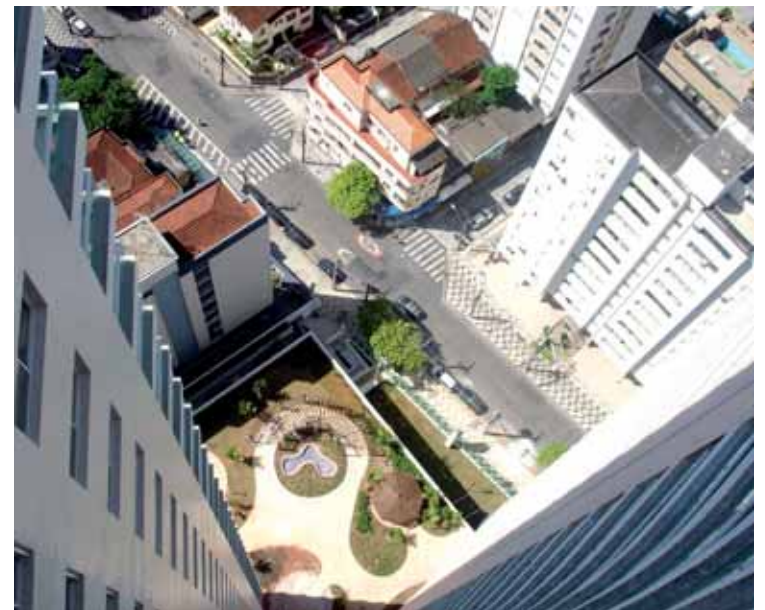
Imagens a partir do térreo, na Avenida Eptácio Pessoa, e da cobertura: de qualquer ângulo, o Cap Ferrat impressiona por sua linha arquitetônica e grandiosidade

A ampla infraestrutura de lazer ocupa o segundo mezanino, distribuída em 1.095 metros quadrados de área coberta. Entre os espaços, piscina coberta aquecida, sauna, spa, lan house, salão de festas adulto e infantil, brinquedoteca, playground, fitness, que estão sendo entregues equipados e decorados. E mais: home office, vestiários masculino e feminino, piscinas externas adulto e infantil, espaço gourmet, churrasqueira, salão de jogos adulto, sala de cinema, quadra de esporte com grama sintética e gazebo.