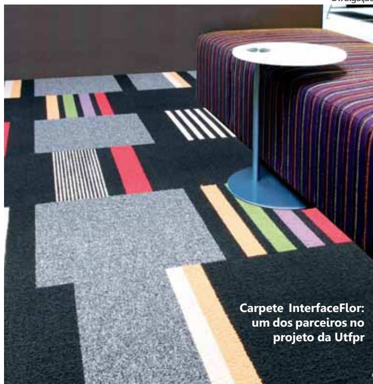
Carpete InterfaceFlor: um dos parceiros no projeto da Utfpr