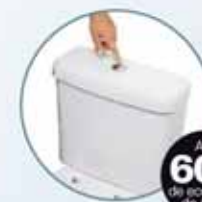
Sistema de acionamento Dual Flux