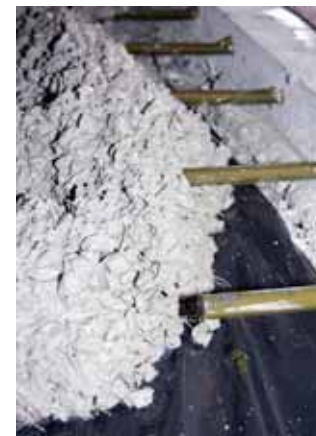
Fibra no concreto

Focada em soluções para pisos industriais, a Locaville lançou a Ecofibra, uma fibra de aço reciclado para ser misturada ao concreto. Ela aumenta a resistência e a durabilidade do piso, inibindo o aparecimento e a propagação de fissuras.