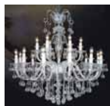
Do despojado ao requintado

O projeto utilizará energia térmica por meio de painéis solares para aquecer a água, sistema de coleta e uso da água da chuva para os vasos sanitários e limpeza, controle da qualidade do ar através de resfriamento evaporativo e desumidificação, janelas em esquadrias de madeira com vidros duplos, iluminação natural e uso de lâmpadas Led, base do piso elevado em plástico reciclado com acabamento em madeira certificada, forro de placas cimentícias de madeira mineralizada, uso de madeira plástica nos decks externos e revestimentos internos com painéis de bambu e móveis ecológicos.