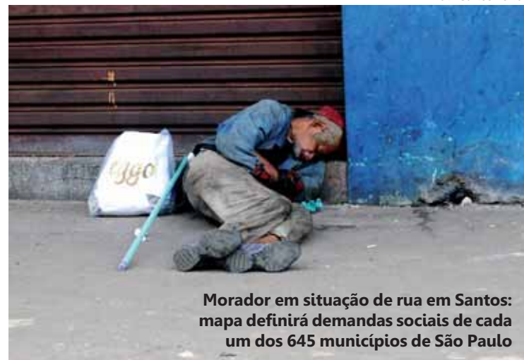
Morador em situação de rua em Santos: mapa definirá demandas sociais de cada um dos 645 municípios de São Paulo

O mapa também vai incluir dados do Pró-Social, sistema implantado pela Seds com o financiamento do Banco Interamericano de Desenvolvimento (BID). Por meio de módulos, o