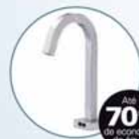
Torneira Decalux Luxo