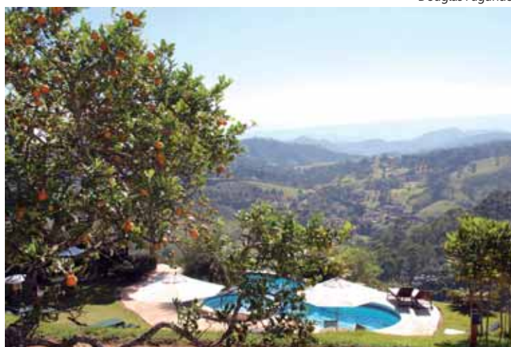
Paisagem da piscina: relaxar e aproveitar a natureza