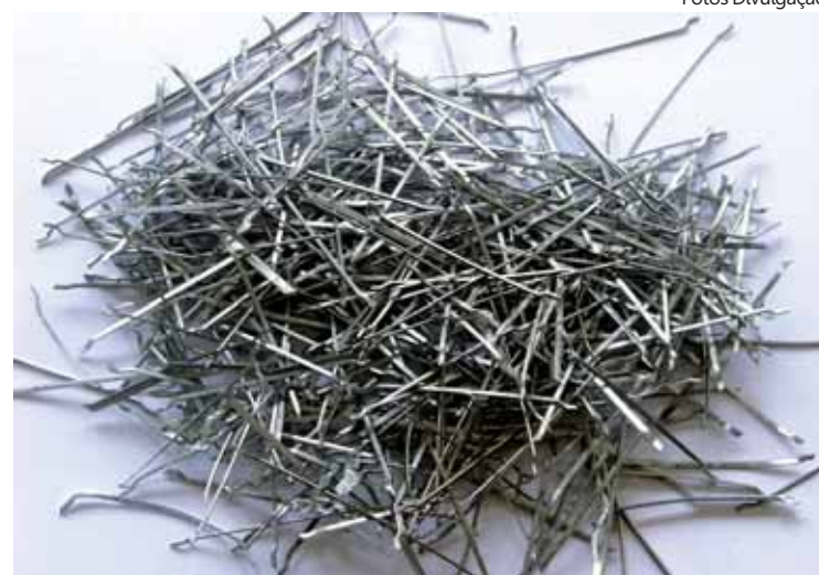
Formato da fibra absorve o impacto e o esforço sobre o piso

A Elétrica Sanchez, especializada em materiais elétricos, lâmpadas e luminárias, ampliou o show room de Santos, na Rua Luiz de Camões, 198, com modernas linhas de lustres, pendentes, plafons, arandelas, spots e abajures, além de lâmpadas e exclusiva fita de Led, importadas dos