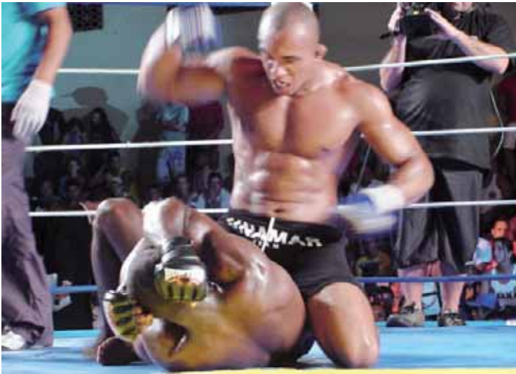
Marcelo Zulu, aquele do BBB4: uma das atrações