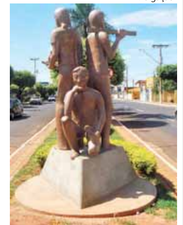
Monumento maçônico em Santa Fé do Sul: líder no ranking ambiental

Da Baixada Santista, nenhuma cidade foi premiada. Entre as 332 que enviaram informações e se candidataram constam: São Vicente, em 60º lugar; Santos (82º); Peruíbe (198º); Guarujá (250º); Itanhaém (266º); e Mongaguá (295º). Estão fora da lista: Cubatão, Praia Grande e Bertioga. As 44 localidades que receberam o selo obtiveram média