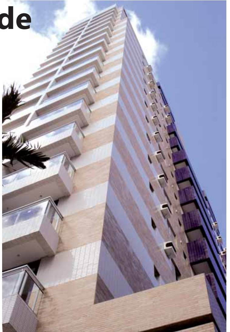
Apartamentos de 58 a 103 m 2 , de 1 e 2 dormitórios, com terraço

A construtora Xavel entregou na Rua Pasteur, 68, no Gonzaga, em Santos, o Residencial Acordes. O diferencial do empreendimento está nos apartamentos de 1 e 2 dormitórios, com 58 a 103 m 2 de área útil, sendo 1 ou 2 suítes com vaga demarcada, para atender pequenas famílias, solteiros, estudantes ou pessoas que estão na cidade a trabalho, mas que não abrem mão de espaço, qualidade e privacidade. São quatro unidades por andar em um prédio totalmente revestido com cerâmica, hall de entrada e elevadores em granito natural, fundações profundas, medição individual de água e gás, e gerador de energia. A área de lazer está localizada no 16º andar e inclui piscina, sauna, sala de ginástica e salão de festas com copa e grill, além de vista panorâmica da cidade. O empreendimento conta também com duas unidades duplex com piscina privativa.