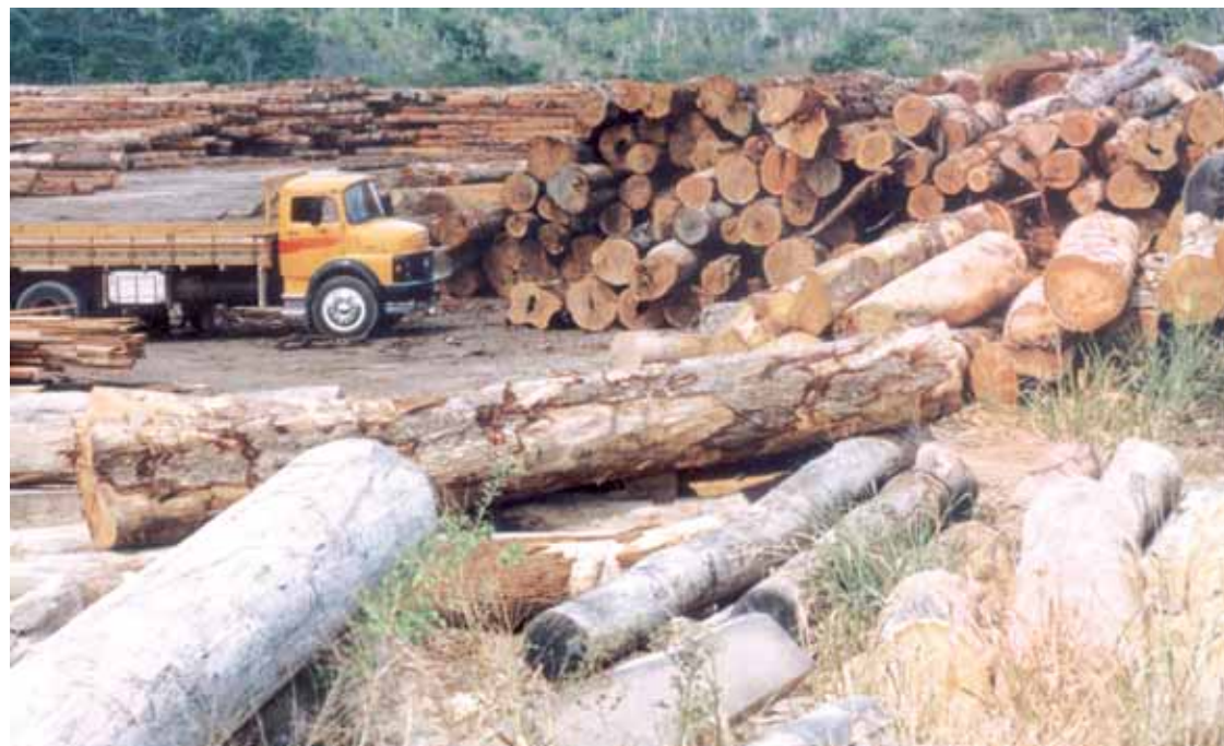
Criar seis novas barreiras do Ibama em rodovias federais para coibir o transporte ilegal de madeira

As operações para desocupação de Florestas Nacionais em Rondônia, programadas para o final de outubro, constituem a base da sétima medida. O ministro pretende oferecer maior apoio aos extrativistas, de modo a equiparar seus direitos com os direitos dos