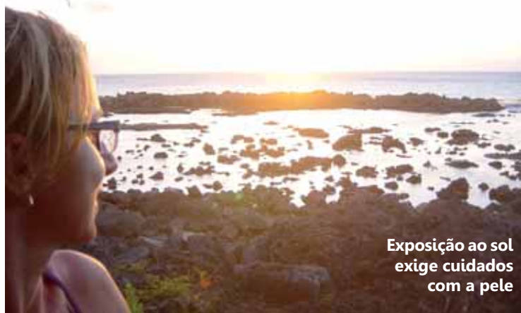
Exposição ao sol exige cuidados com a pele

Um dos grandes aliados à prevenção do câncer de pele é o filtro solar, porém sua má utilização pode não resultar em uma defesa eficiente contra a doença. Em geral,