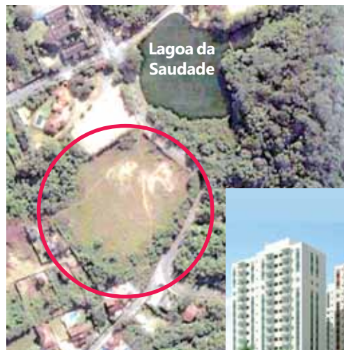
Na imagem de satélite, a área ao lado da Lagoa

Para isso, foi montado o site www.soslagoa.com.br e começou a circular um abaixo-assinado, que já conta com 2.800 adesões. Simultaneamente, foi solicitada a realização de audiência pública pela Câmara Municipal e contatado o