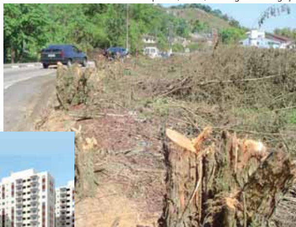
Antes de iniciar obras, Tenda cortou árvores nativas no entorno da área e gerou protesto da comunidade

Ministério Público Estadual, para avaliar a possibilidade de ingressar com medida judicial.