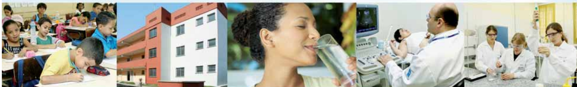
Construção, reforma e ampliação de escolas