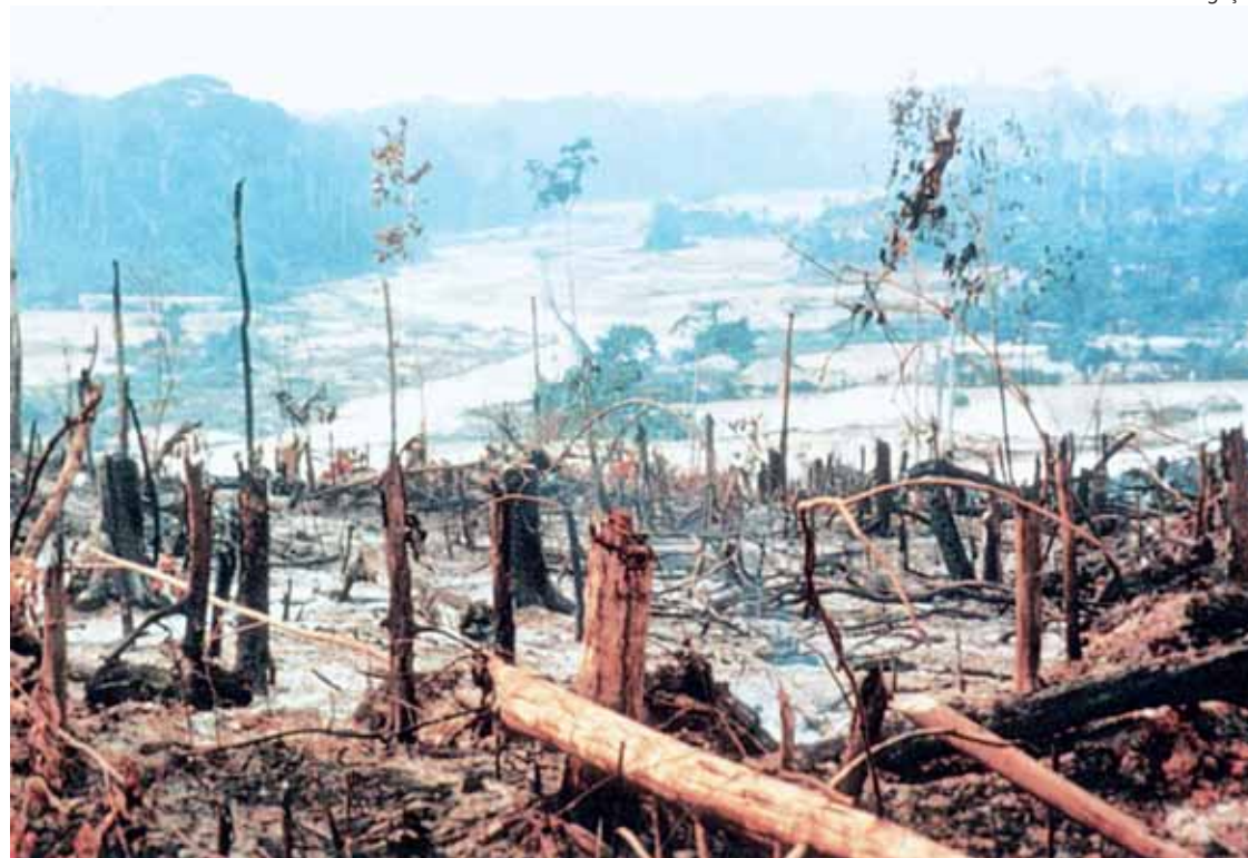
Entre 2006 e 2007, cada um dos seis assentamentos desmatou áreas que de 17.497 ha a 49.698 ha

A reativação do Plano de Ação para a Prevenção e Controle do Desmatamento na Amazônia Legal (Ppcdam), com apoio à elaboração dos planos estaduais de combate ao desmatamento, é a terceira medida. O objetivo é estimular as ações da operação "Arco Verde" e fortalecer