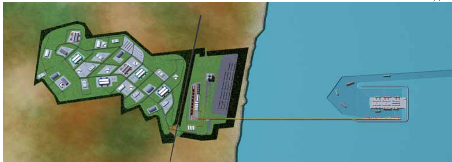
Acima, a maquete eletrônica destaca a ilha artificial, com sete berços de atracação, ligada por uma ponte ao continente, onde será implantado o retroporto, abaixo, entre o bairro Ruínas e a divisa com Itanhaém

O investimento é de US$ 2 bilhões e envolve parceiros internacionais, que já participam do controle acionário da LLX Logística, uma das empresas de Eike, responsável pelo desenho do Porto Brasil. Em julho do ano passado a MMX Mineração de Metálicos,