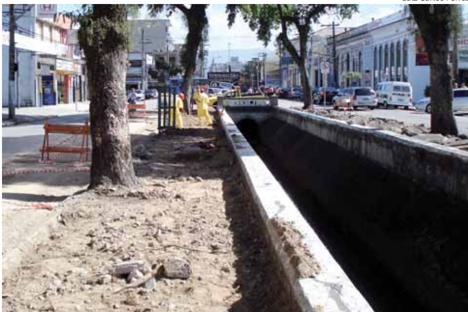
Canal 3: piso das calçadas está sendo trocado por placas de concreto desempenado