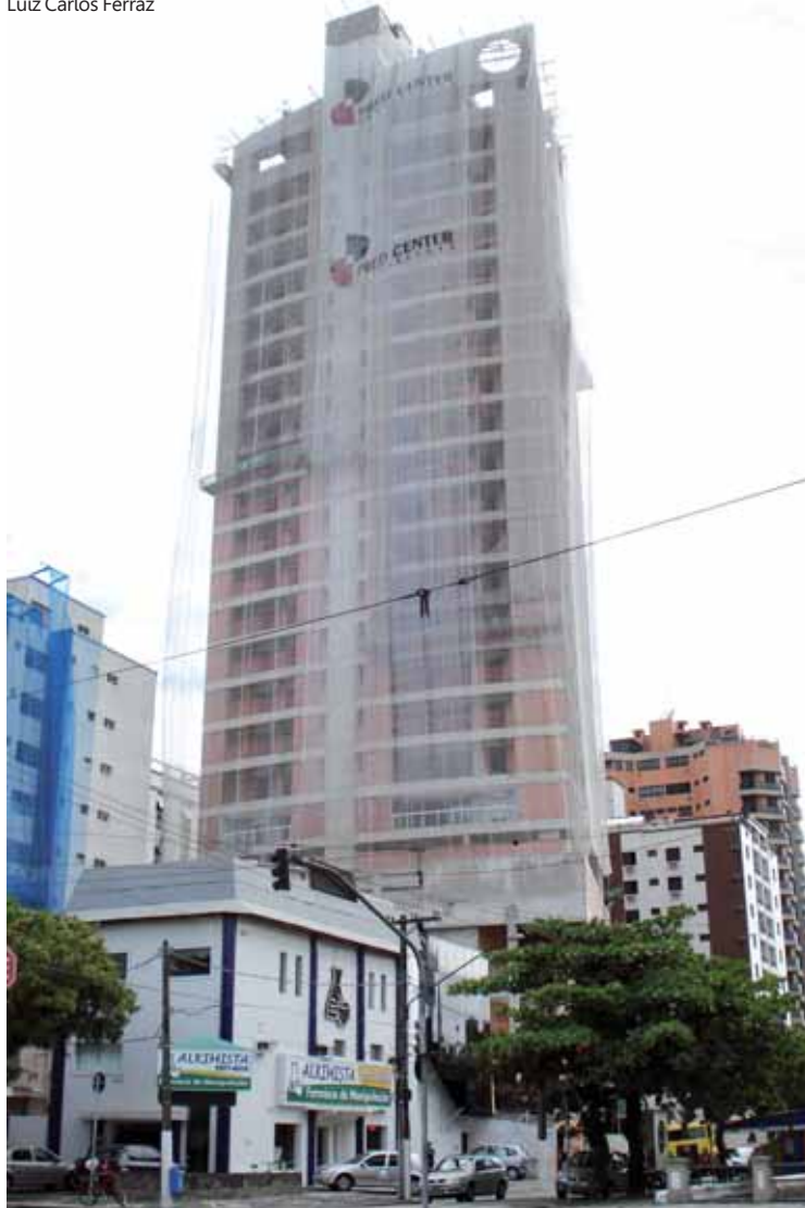
Localizado no Canal 6, terraços e salas estão de frente para a praia: vista deslumbrante de toda a baía de Santos