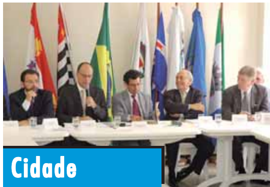
No encontro, o prefeito Papa, de Santos, transferiu o comando do órgão para o prefeito Tércio, de São Vicente