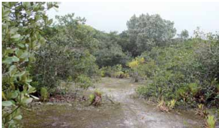
Área do retroporto em Peruíbe tem 5 km de frente para o mar