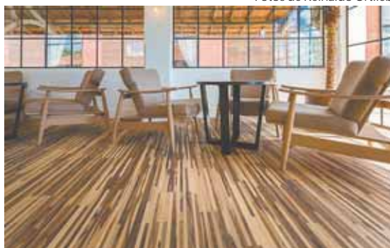
Multistrato Sucupira e Multistrato Legno Demolição Guaiuvira: pisos da Indusparquet