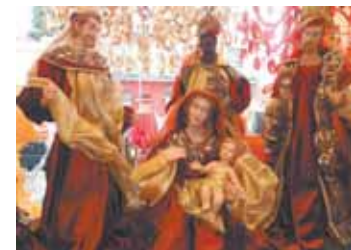
Presépio encantado: incrível!

“O presépio encantado é incrível”, afirma Irani: “Importado de Dubai, ele é feito com belas imagens, decoradas com tecido finíssimo, e nos transporta ao momento mágico do nascimento de