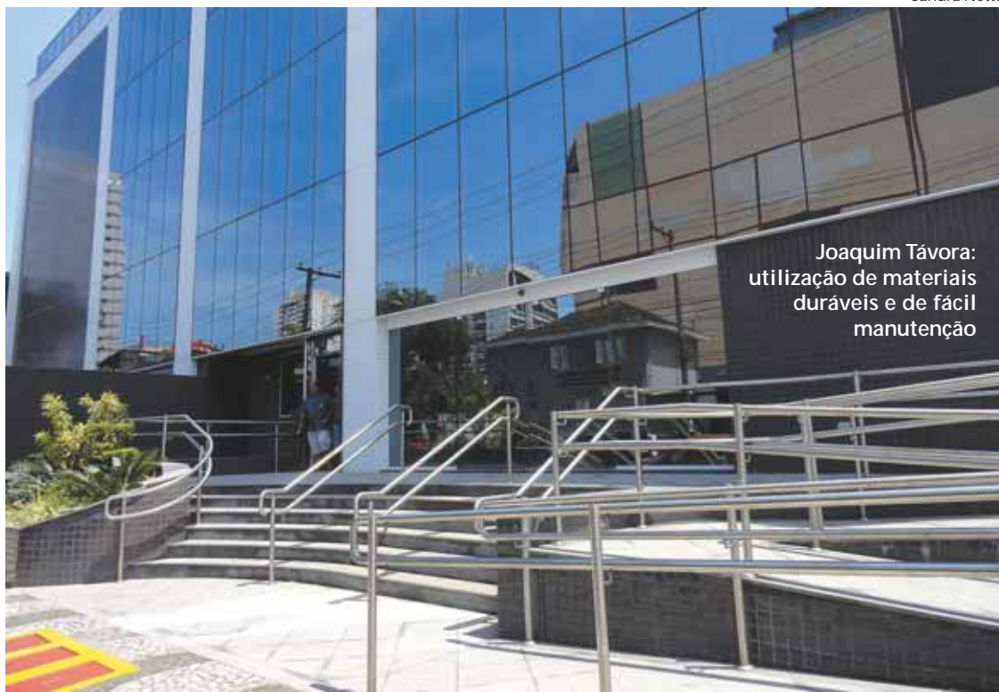
Joaquim Távora: utilização de materiais duráveis e de fácil manutenção