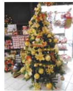
Árvores: muito brilho