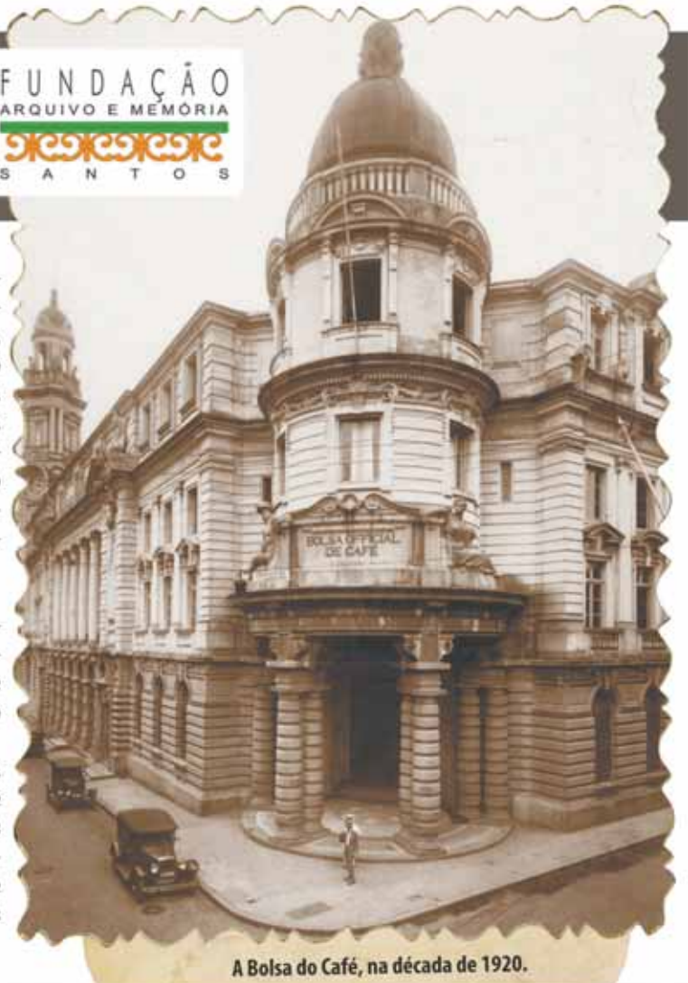
A Bolsa do Café, na década de 1920.

Para que o local se tornasse uma vitrine da diversidade do café brasileiro, foram criadas diversas ações, entre elas a disponibilização de uma cafeteria, que oferece café a partir de grãos cultivados em várias regiões do país.