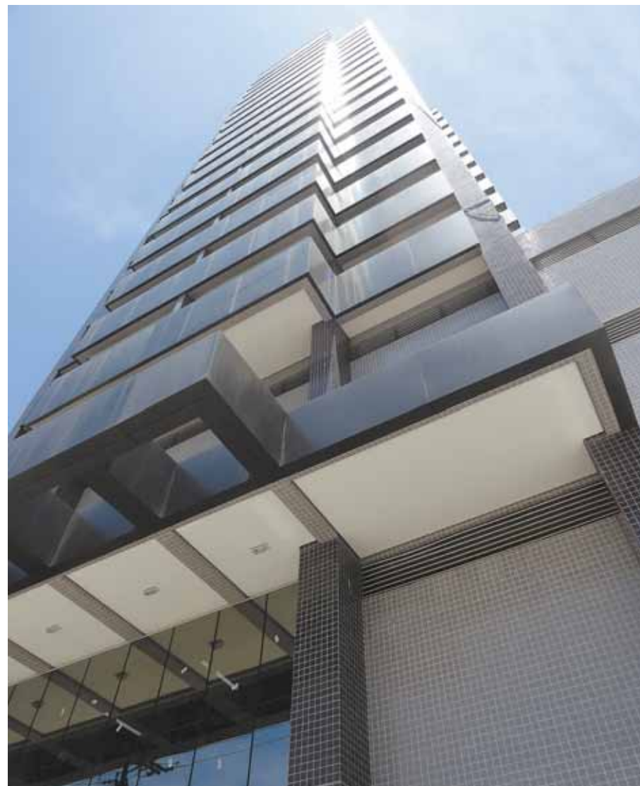
Legacy Tower: torre única tem localização privilegiada e adota o padrão dos melhores corporativos da capital paulista